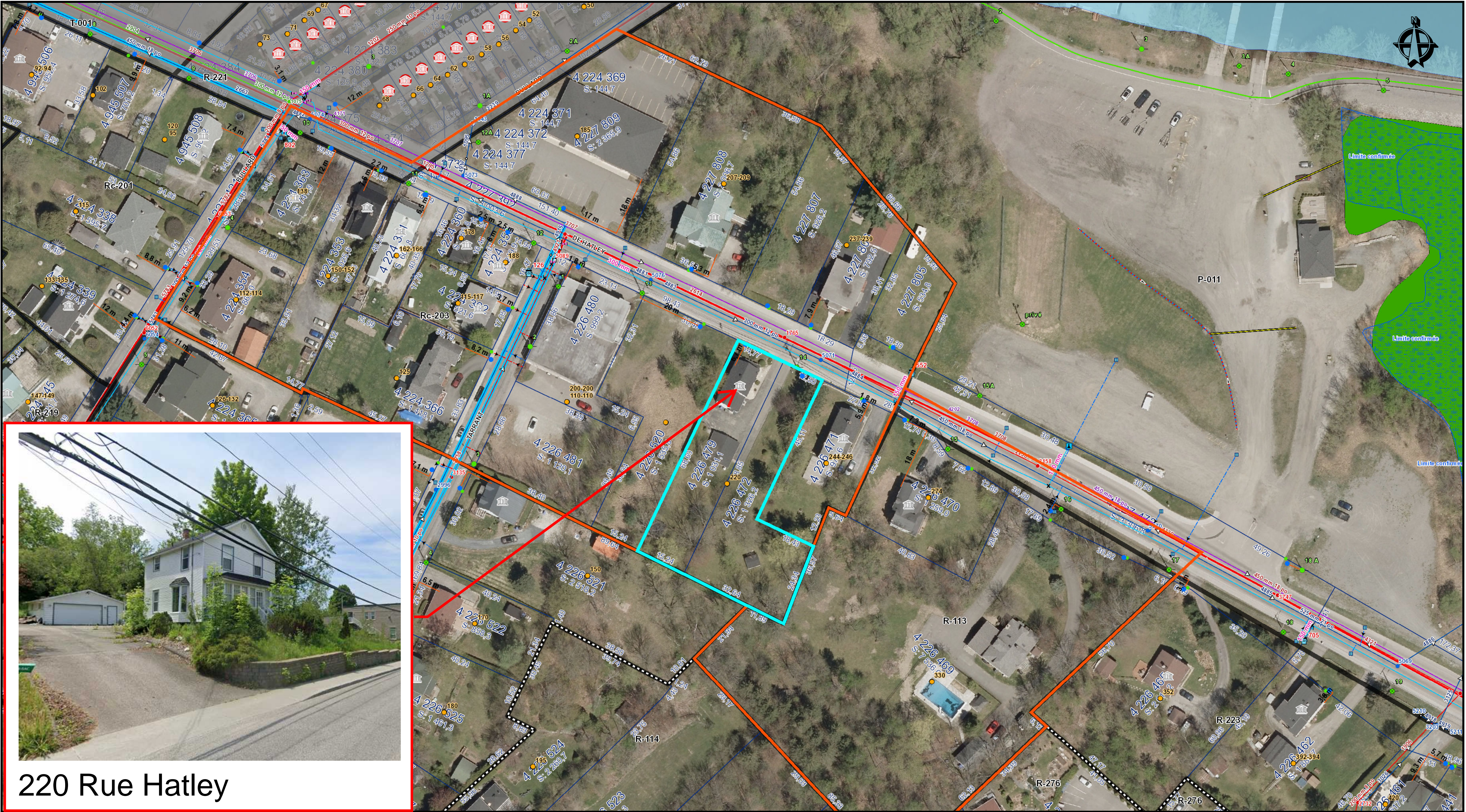
220 Rue Hatley

Les informations contenues dans le présent site Internet sont la propriété de la ville de Magog et sont destinées à l'usage exclusif de ses employés(e)s pour fins de consultation ou étude. La ville de Magog ne se porte aucunement garante de quelque document, donnée ou information contenus sur le présent site Internet. De plus, en cas de divergence entre un texte officiel et le contenu de ce site, le texte officiel a préséance. Copie de tout texte officiel peut être obtenu, moyennant des frais raisonnables, auprès de la mairie de la ville de Magog. Données produites par : La Ville de Magog. Date de la dernière mise à jour : 2024-06-03