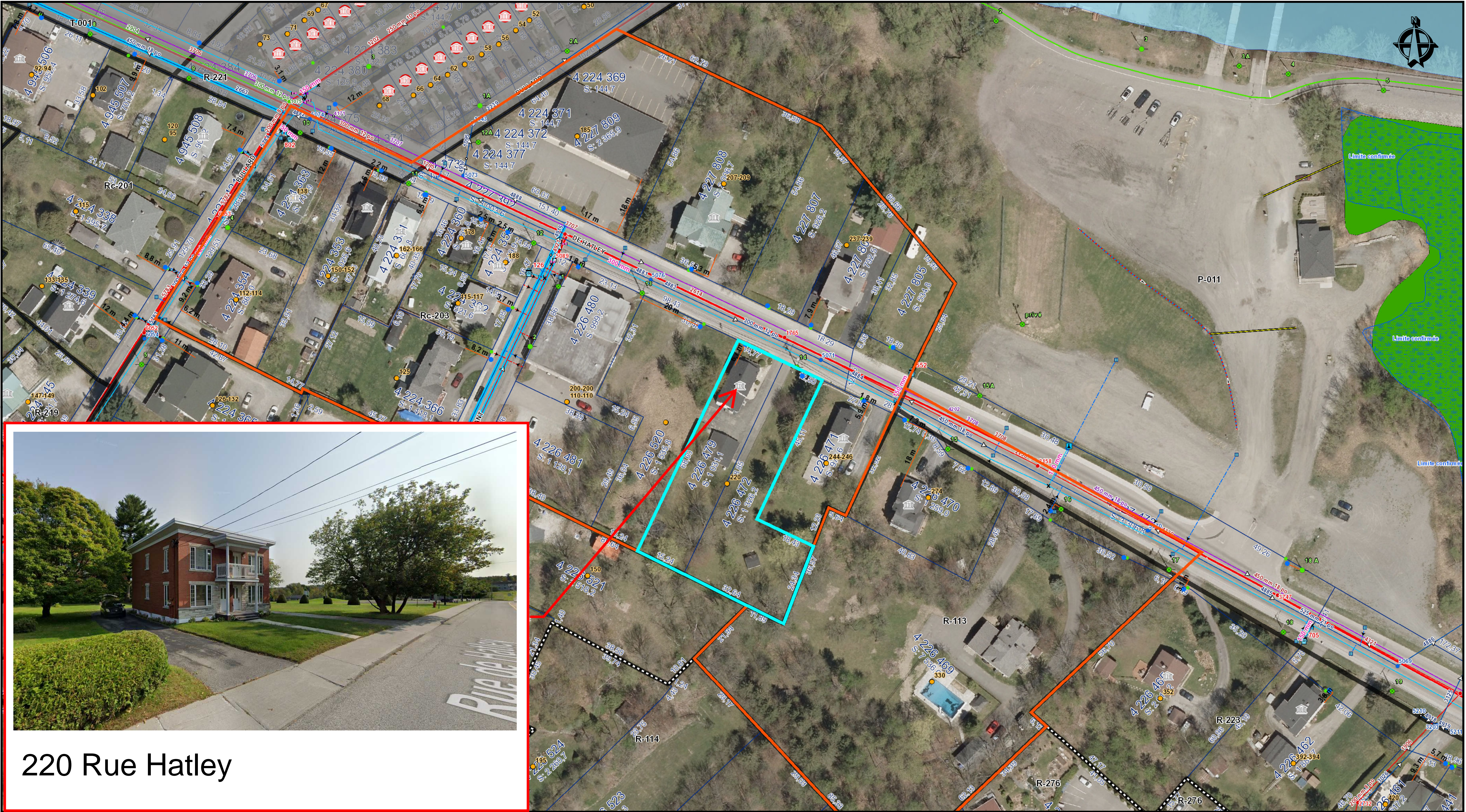
220 Rue Hatley

Les informations contenues dans le présent site Internet sont la propriété de la ville de Magog et sont destinées à l'usage exclusif de ses employé(e)s pour fins de consultation ou étude. La ville de Magog ne se porte aucunement garante de quelque document, donnée ou information contenus sur le présent site Internet. De plus, en cas de divergence entre un texte officiel et le contenu de ce site, le texte officiel a préséance. Copie de tout texte officiel peut être obtenu, moyennant des frais raisonnables, auprès de la mairie de la ville de Magog. Données produites par : La Ville de Magog. Date de la dernière mise à jour : 2024-06-03