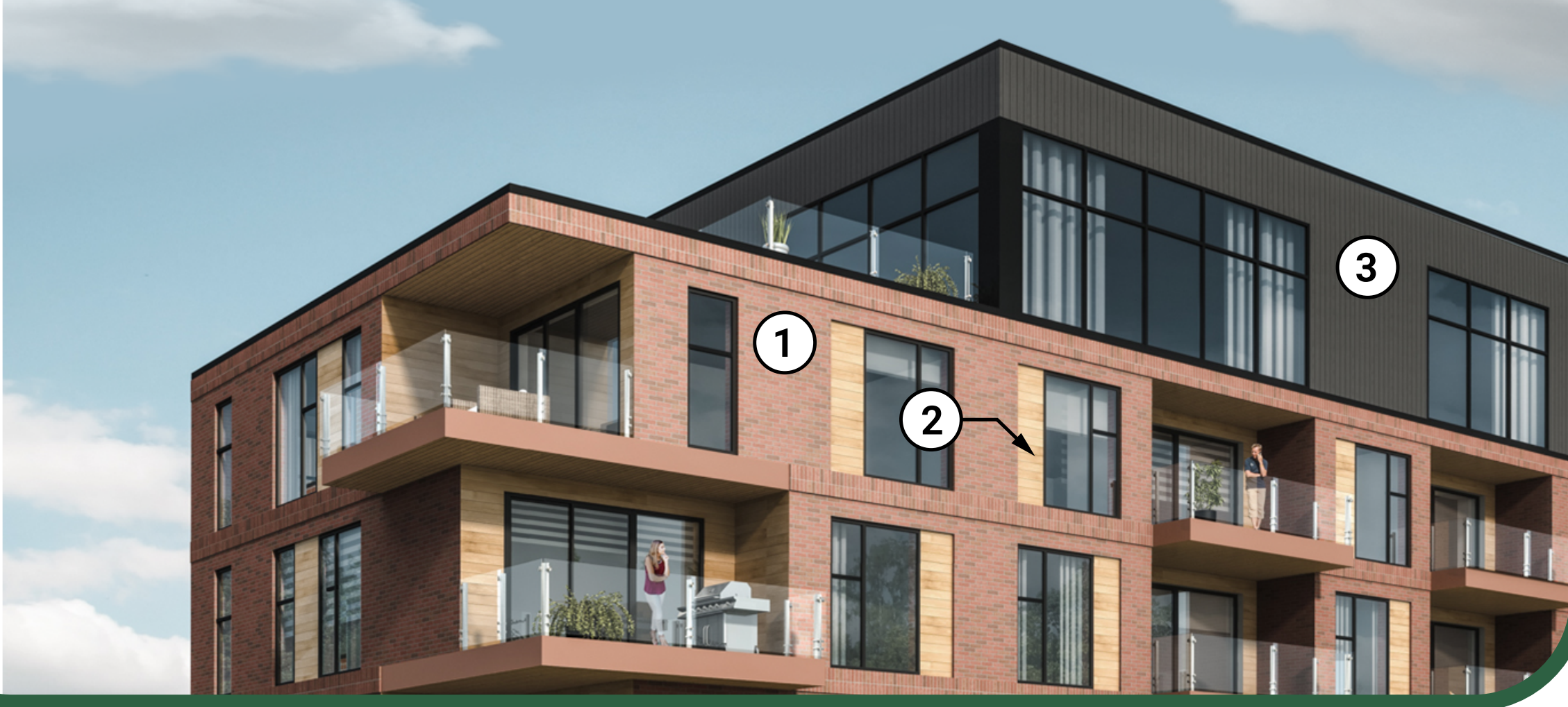
BRIQUE D'ARGILE, COULEUR ROUGE