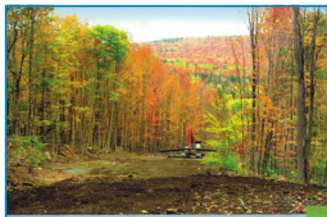
GUIDE POUR CONTRER L'ÉROSION DES CHEMINS FORESTIERS